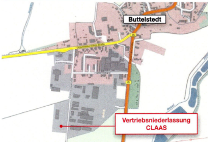
Standortübersicht „Vertriebsniederlassung CLAAS“ westlich Buttstedt der Gemeinde Am Ettersberg Kartenhintergrund: Geobasisdaten TLBG (Stand: 05/2022)